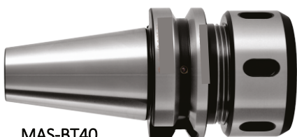
MAS-BT40 • SLIKE SO SIMBOLIČNE