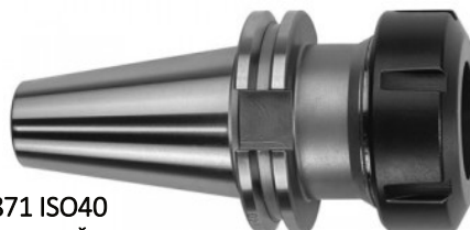
DIN 69871 ISO40 • SLIKE SO SIMBOLIČNE